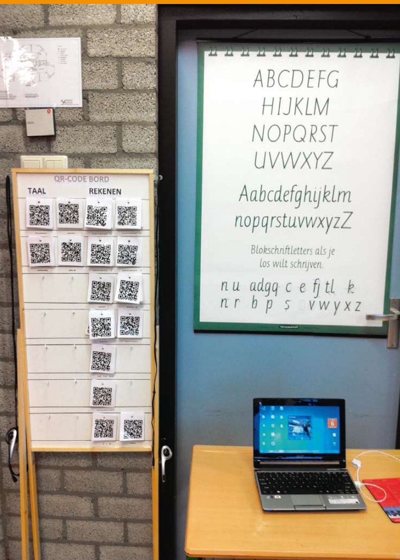
De QR-codes in een klaslokaal op de St. Nicolaasschool in Nieuweveen verwijzen naar uitlegfilmpjes op Youtube. Kinderen kunnen de codes scannen en zo zelfstandig iets bestuderen.