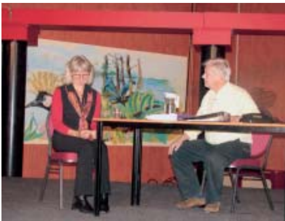
Een hilarisch toneelstuk over een beoordelingsgesprek op de personeelsdag van Stichting Katholiek Onderwijs Drenthe die de AVS organiseerde.

De AVS heeft in de voorbije jaren een brede ervaring opgebouwd in het organiseren van inspirerende en motiverende personeelsdagen. Voor 50 tot 1500 personeelsleden verzorgt de AVS de inhoudelijke kant van uw personeelsdag: van inleiding tot afsluiting, of alleen een aantal workshops. Op maat voor elke school of ieder bestuur gemaakt. Ook in de totale organisatie van zo'n dag kan de AVS haar leden ondersteunen.