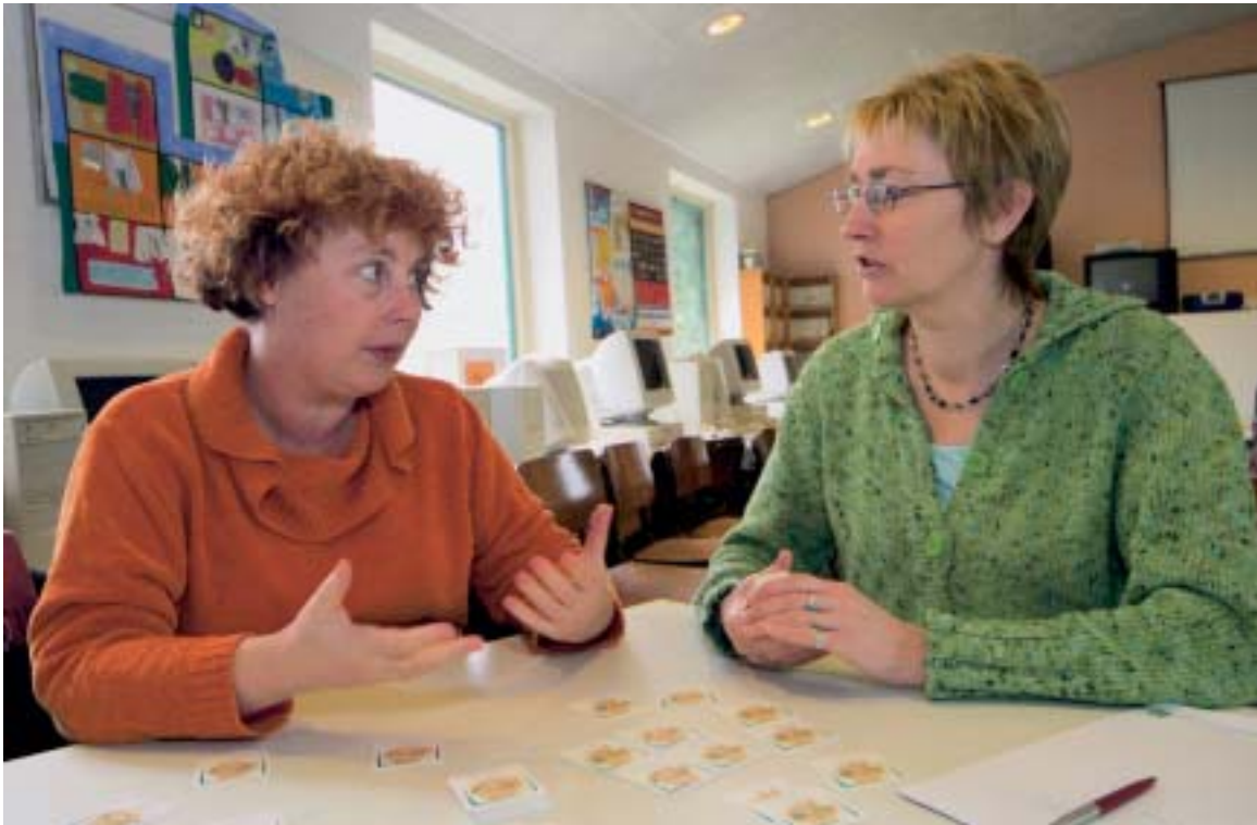
Cursisten van de opleiding Oriëntatie op Management houden zich bezig met de vraag “zou leidinggeven iets voor mij zijn?”