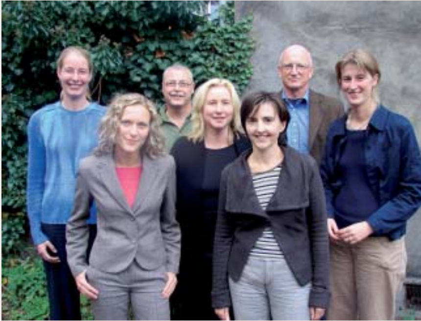
De medewerkers van Stichting Support.