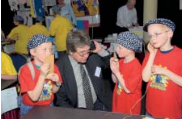
De kinderjury beoordeelt de techniekproefjes van de tien deelnemers aan het project 'Meester hoe werkt het?'

Op verzoek van OCW voert de AVS, deels samen met Schoolmanagers_VO en de VBS, deels mede namens deze organisaties, een aantal activiteiten uit gericht op besturen en directies. Doel van deze activiteiten is het enthousiasmeren van besturen en directies, opdat het sporten van leerlingen binnen en buiten de schooluren en schoolmuren een dagelijkse realiteit wordt.