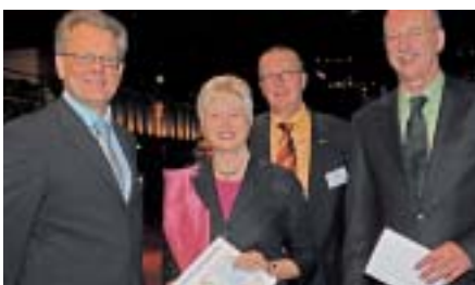
Het AVS-congres 2006 'Voor elkaar', ontmoetingsplek voor schoolleiders uit het hele land, o.a. met workshops en een inleiding door Maria van der Hoeven. Op het congres was er verder een informatiemarkt, een AVS-plein en het project 'Meester hoe werkt het?'