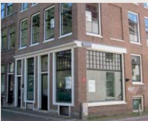
De AVS houdt kantoor in vier panden aan de Nieuwegracht, nummer 1-3, 23 en 29.