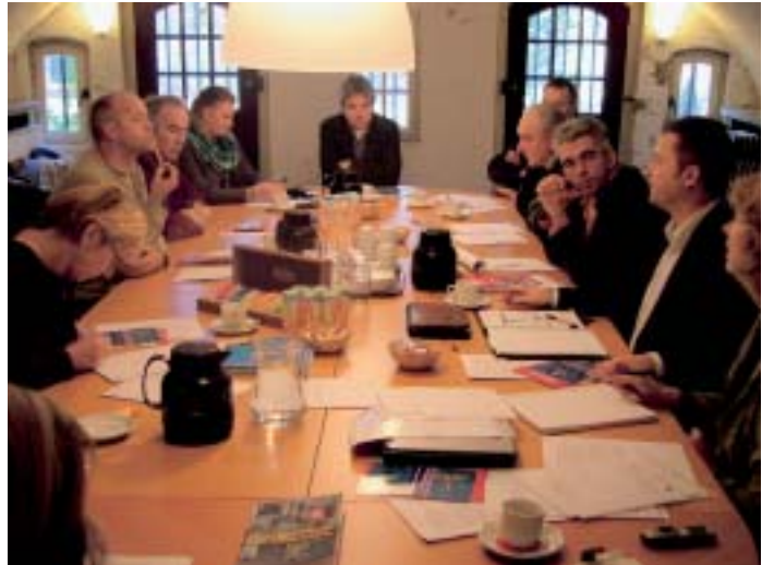
De commissie onderwijs vergadert in de werfkelder aan de gracht op Nieuwegracht 29.