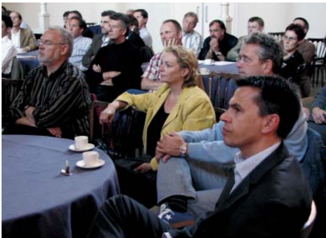
→ Deelnemers aan de opleiding bovenschools management

Opgeteld bij een demografische ontwikkeling met name toegespitst op schoolleiders, waarbij het aantal vacatures de komende jaren toeneemt, hoeven we ons in dit vak niet te vervelen. Als we iets meer afstand nemen van de dagelijkse gang van zaken constateren we dat dit allemaal hoort bij de professionalisering van de sector primair onderwijs. Dit bewustwordingsproces is pure winst voor de sector, maar wordt op het moment wel ervaren als een worsteling.