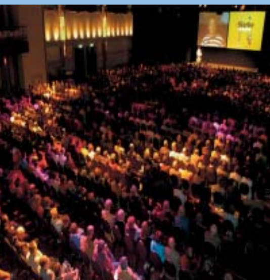
→ AVS-jubileumcongres 2005; trefpunt van schoolleiders uit het hele land met gastsprekers, workshops, infomarkt en swingen op Loïs Lane

Na deze drukke en zeer gezellige dag smaakte het diner, muzikaal omlijst door Divina Close Harmony, uiteraard uitstekend.