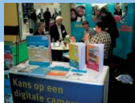
→ De AVS present op de Nationale Onderwijstentoonstelling (NOT)