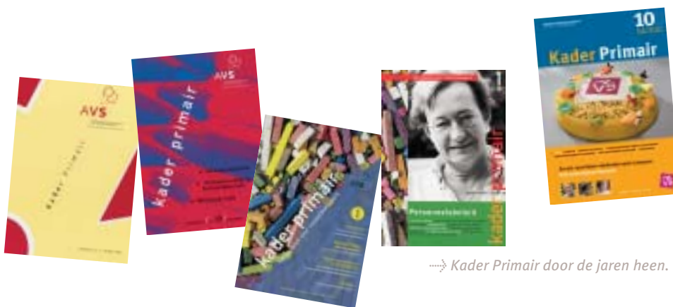
→ Kader Primair door de jaren heen. De honderdste uitgave verscheen juni 2005

Sommige netwerken kennen een overweldigende belangstelling. De intentie is het komende jaar meer verdieping aan de netwerken te geven en met thema's en gastsprekers te werken als onderdeel van de netwerkdag. Het bestuur van de vereniging gaat tevens het land in om nauwer betrokken te worden bij de leden.