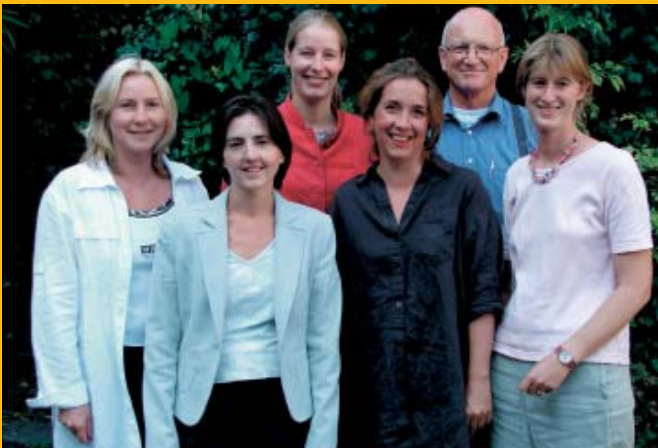
..... De medewerkers van Stichting Support

Gedurende het verslagjaar werd, na veel strubbelingen binnen de werkgeversdelegatie, overeenstemming bereikt over de verlenging van de werkingsduur van de CAO-PO 2002–2004 met een jaar. Het overleg over de CAO-PO vindt plaats tussen de vak- en de besturenorganisaties en betreft de secundaire arbeidsvoorwaarden van het onderwijspersoneel plus een aantal afspraken over personeelsbeleid. Er werden niet alleen afspraken gemaakt over de verlenging van de werkingsduur. Vooral met het oog op de voorbereiding van de invoering van de lumpsumbekostiging en de daarmee samenhangende noodzaak van professionalisering en versterking van de medezeggenschap werden afspraken gemaakt over een nieuwe faciliteitenregeling voor leden van de P(G)MR. Daarnaast werd onder andere een aantal bepalingen over scholing en persoonlijke ontwikkeling opgenomen. In maart 2005 hielden de overlegpartners zich tijdens een studiedag bezig met de vraag hoe de toekomstige CAO's voor het primair onderwijs ingericht moeten worden. Daarbij kwam ook de vraag aan de orde wat de gevolgen zijn van de decentralisatie van een aantal hoofdstukken van het Rechtspositiebesluit WPO/WEC naar de CAO-PO.